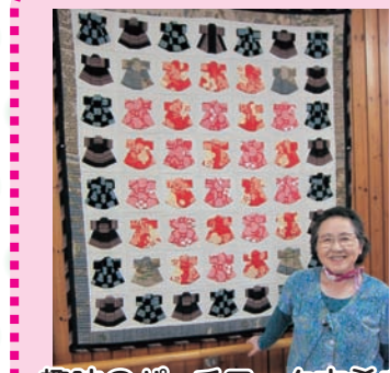
趣味の Patchwork 古希を 作った作品です。