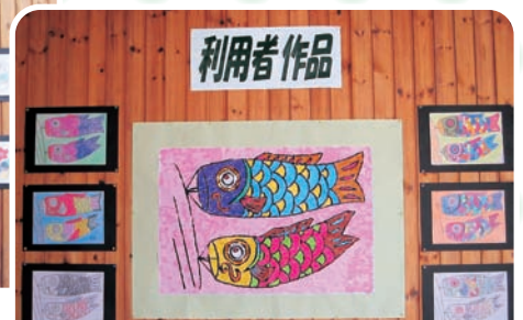
迫力あるこいのぼり おり紙をちぎって作った貼り絵