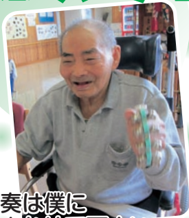
伴奏は僕に まかせて下さい。