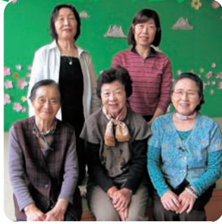
歌の会ボランティアの皆さん