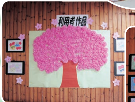
皆で作った桜の木