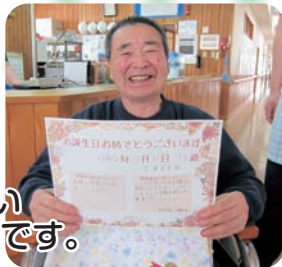
皆に祝ってもらい 満面の笑顔です。