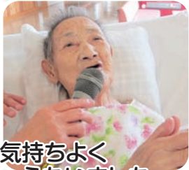
気持ちよく うたいました